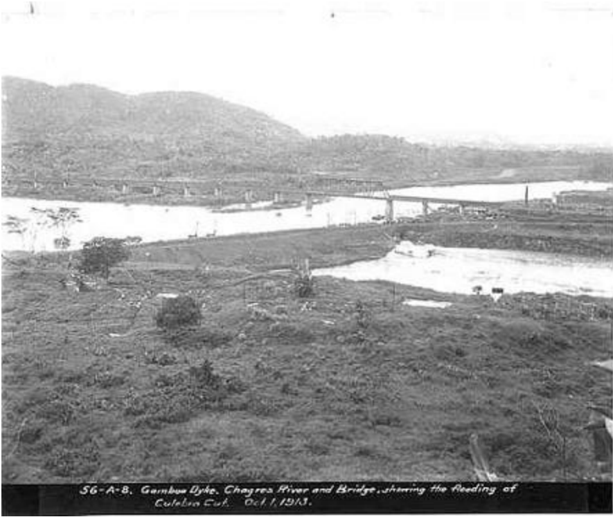
চিত্র ৩: পানামা ক্যানেল ১৯১৪ মাদ

আজ ২০০৫ সালেও আমেরিকার 'ল্যাটিন আমেরিকা' নীতি একটুও বদলায় নি!