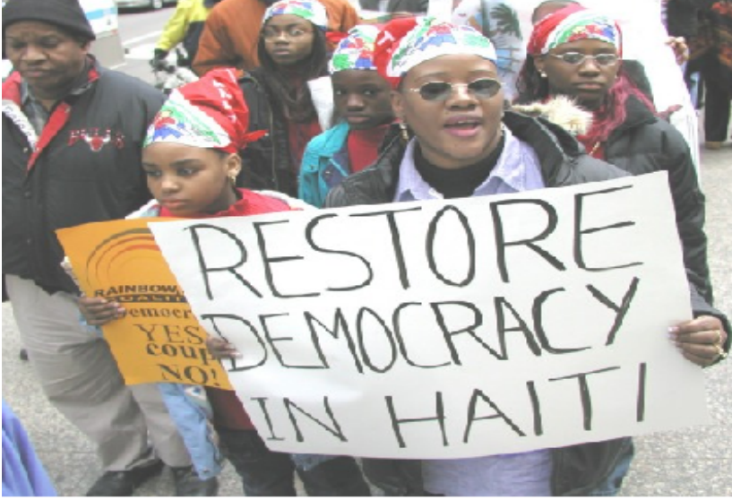
চিত্র ১: আমেরিকা যারে গনশ্রম কয়, কয় না সেই দেশের দোক

করে। এরপরে গত পঞ্চাশ বছরে আমেরিকা যেখানেই জার্মানী মডেল অনুসরণ করতে গেছে, সেখানেই মিলেছে ব্যর্থতা!