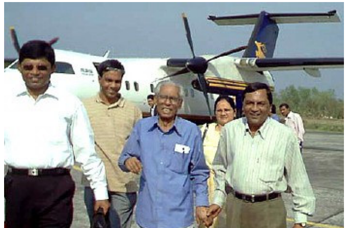
মৃত্যুর মাত্র সাতদিন আগে বরিশালের মেয়র কর্তৃক প্রদত্ত পুরস্কার গ্রহণের জন্য বরিশাল যান, সাথে আমার ছোট ভাই ও বড় বোন

মহান ভাষা আন্দোলনের মাস ফেব্রুয়ারীর ২৬ তারিখ বাবা যাত্রা করলেন অনন্তলোকে। আমি হারালাম আমার সবচেয়ে প্রিয় মানুষটাকে - যাকে আমি আমার আদর্শ হিসেবে জীবনে গ্রহণ করেছি। বাবার মত নীতিবান, সৎ আর মানবতাবাদী মানুষ আমার জীবনে আমি কমই দেখেছি।