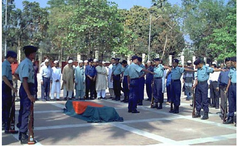
মৃত্যুর পর রাষ্ট্রীয়ভাবে সম্মান জানানো হয় বাবাকে

হলেও যে গরীব মানুষের উপকার করা কর্তব্য - সেটা বাবার কাছে শিখেছি। মানুষ যদি মানুষের উপকারে না-ই আসলো - তবে আর মনুষ্যত্ব কোথায়। আজকের বাংলাদেশে এটাই বড় অভাব। আজকে আমাদের দেশে চারিদিকে যে এত অন্ধকার - আমার মনে হয় আলো জ্বালাবার লোকগুলো ধীরে ধীরে হারিয়ে যাচ্ছেন আমাদের সমাজ থেকে। যারাও বা আছেন - তারা আজ নিভৃতচারী। আমাদের পরবর্তী প্রজন্মের সামনে নেই কোন আদর্শ। সততা, নিষ্ঠা, দেশপ্রেম আজ কেবল কথার কথা। আমাদের গৌরবময় মুক্তিযুদ্ধ, স্বাধীনতা, ধর্মনিরপেক্ষতা, সমাজতন্ত্র - এ সব চেতনা আজ আমরা হারিয়ে ফেলেছি। আজ আমাদের আবার এক হওয়া প্রয়োজন সেসব চেতনা ফিরিয়ে আনার জন্য।