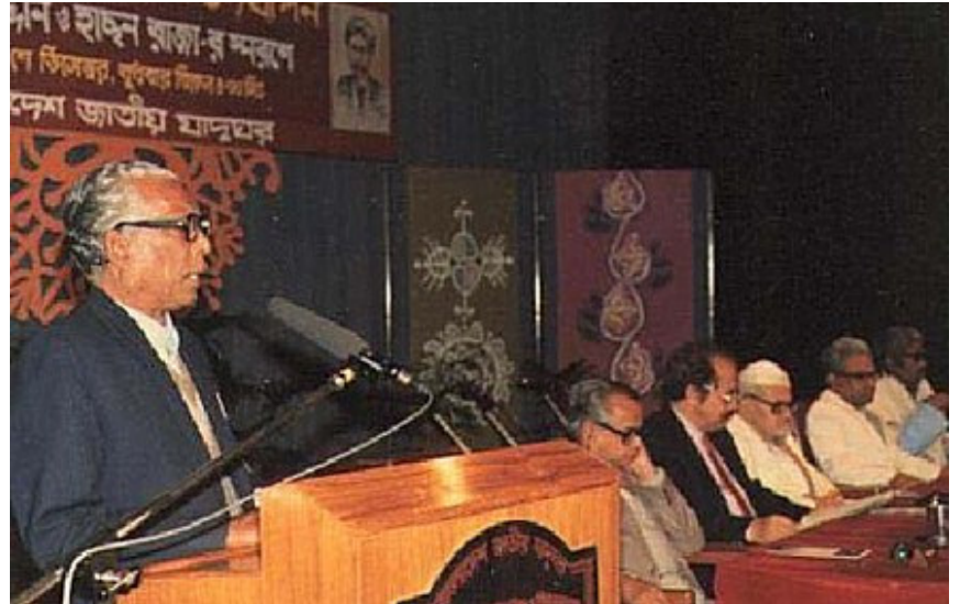
মরণী শিল্পী হাসন রাজা স্মরণে আয়োজিত অনুষ্ঠানে বক্তৃতারত বাবা

বাবা খুব কষ্ট পেয়েছিলেন যখন বাংলা-একাডেমীতে একবার গান গাইতে গিয়ে কিছু উচ্ছৃঙ্খল ছাত্ররা বাবাকে অপমান করেছিল। গানটার বিষয়বস্তু ছিল হালে ছাত্রদের নৈতিক আবক্ষয়। বাবা বলেছিলেন যে ছাত্ররা ভাষা আন্দোলন করেছে, মুক্তিযুদ্ধ করেছে - সেই ছাত্রদের হাতে এখনও অস্ত্র কেন, কেন তারা হাইজ্যাকার হয়ে যাচ্ছে, কেন তারা মেয়েদের