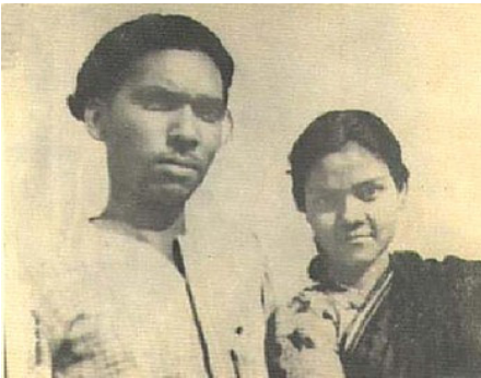
বিয়ের পর বাবা-মা (১৯৫৩)

দেশ ভাগের পর ১৯৪৮ এ ঢাকা ফিরে এলেন বাবা। সে বছরই অডিশন দিয়ে পাশ করলেন। বাবা প্রথম যে গান করেছিলেন রেডিওতে - সেটি ছিল নিজের লেখা ও সুর করা। গানটির কথা ছিল: