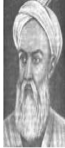
ইবনে সিনা (Avicenna)