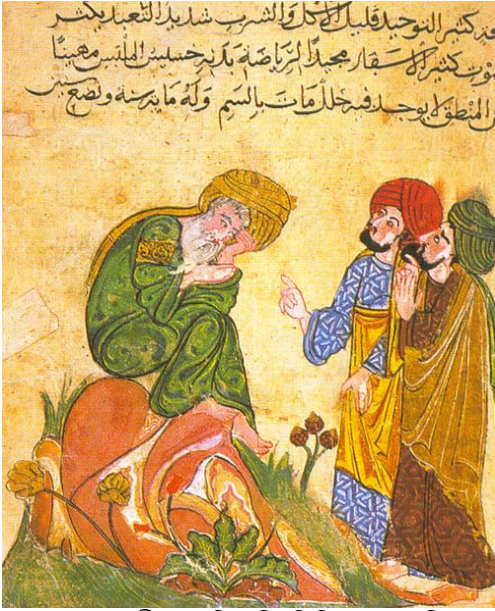
তেরোশ শতাব্দীর মুসলিম চিত্রলিপিতে সফ্রেটিসকে শিষ্যসহ দেখা যাচ্ছে

এলজেবরা বা বীজ গণিত এর সূত্রপাত ঘটান। এ গ্রন্থটি ল্যাটিন ভাষায় অনূদিত হলে পশ্চিমারা বীজ গণিত সম্পর্কে জানতে পারে। এলগরিদম এর ও সূচনা ঘটে আল-খওয়ারিজমির হাতে। একই সময়ে আল বাত্তানি ত্রিকোণমিতি (trigonometry) এর উন্নতি সাধন করেন। গণিত শাস্ত্রের পাশাপাশি জ্যোতির্বিজ্ঞান (astronomy) এর উন্নতির ক্ষেত্রে ও মুসলিম মনীষীদের রয়েছে ব্যাপক অবদান। গণিত বিদ ও জ্যোতির্বিদ আল-বিরুনি (মৃত্যু ১০৪৮ সাল) এই মতবাদ পোষণ করতেন যে, ঘূর্ণনশীল মহাবিশ্বের আকৃতি হচ্ছে গোল এবং মোটে ও চ্যাপ্টা নয়, যা সেই সময়ে অনেক বিশ্বাস করতেন। এ ছাড়া আল-বিরুনি নির্ভুলভাবে পৃথিবীর দ্রাঘিমা ও অক্ষাংশের হিসাব বের করেন। একই রকম ভাবে জ্যোতির্বিজ্ঞানের ইতিহাসে বিখ্যাত হয়ে আছেন আল-সূফী, আল-জারকালি প্রমুখ মুসলিম মনীষীরা।