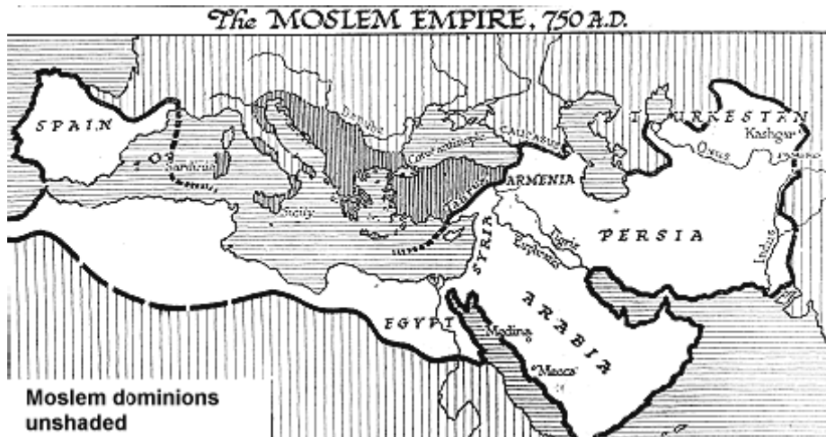
মধ্যযুগে মুসলিম সাম্রাজ্যের বিস্তৃতি (ম্যাপের সাদা অংশ)